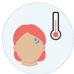
Feber med frysningar