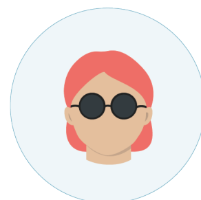
Følsomhet for sterkt lys