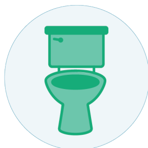
Kvalme, oppkast og diaré